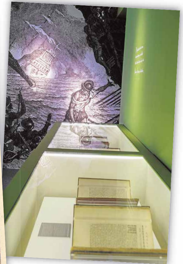
La muestra incluye una colección de grabados y cerca de 200 traducciones de las obras de Miguel de Cervantes

El Museo Casa Natal de Cervantes acoge una exposición para poner en valor la riqueza bibliográfica que atesora